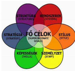
McKinsey 7 S modell alapján